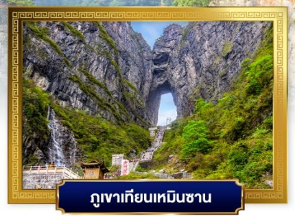
ภูเขาเทียนเหมินซาน